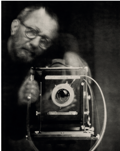
Paolo Roversi, Selfportrait, Paris 2011