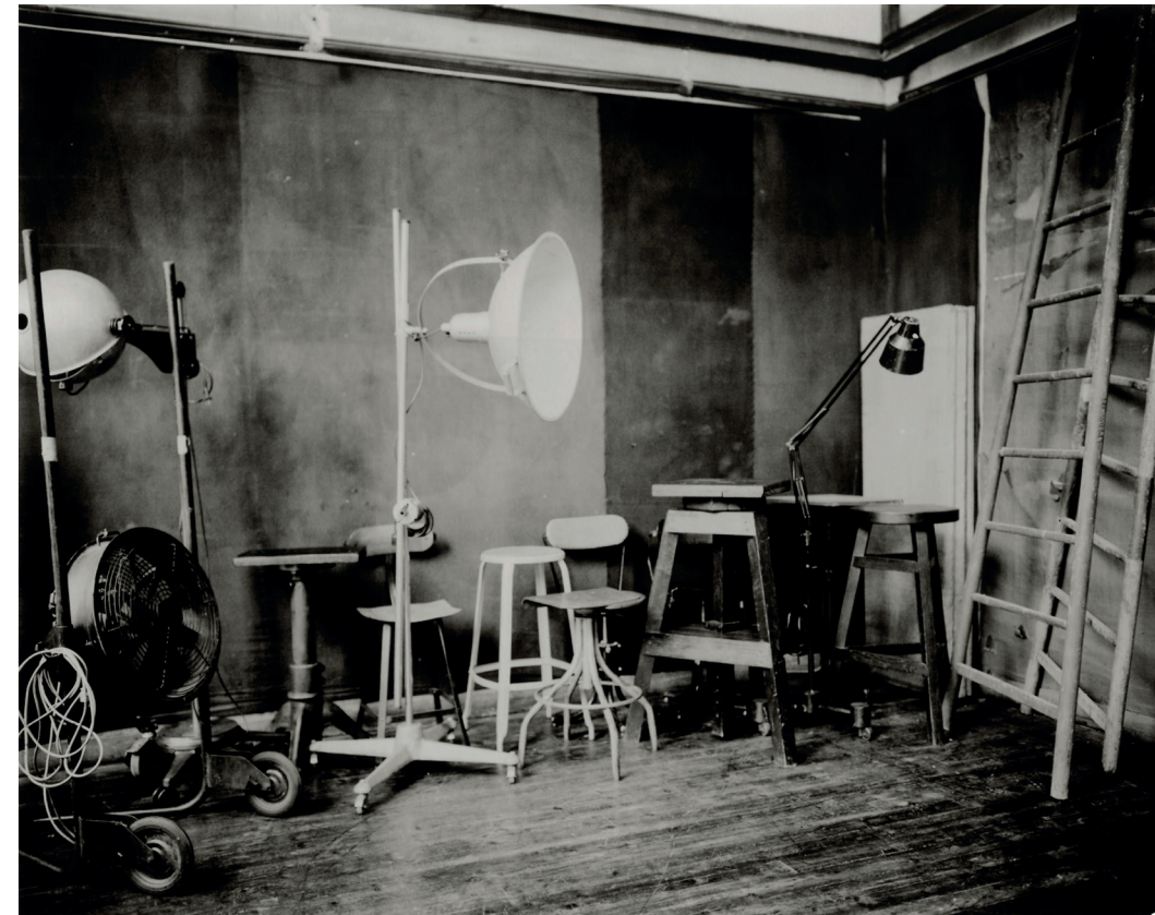
Paolo Roversi, Studio , Paris 2002

Among his most recent works, some shots for the Pirelli 2020 Calendar will be exhibited, as well as a series of previously unreleased fashion shots from his decades of work for brands such as DIOR and Comme des Garçons and for magazines such as Vogue Italia . As a tribute to the seven-hundredth anniversary of Dante Alighieri's death, there will be a vast selection of shots directly from Roversi's archive that celebrate and reinvent the figure of the muse – as an ideal reference to Dante's Beatrice from the Divina Commedia – interpreted here in a contemporary way by iconic women such as Natalia Vodianova, Kate Moss, Naomi Campbell and Rihanna .